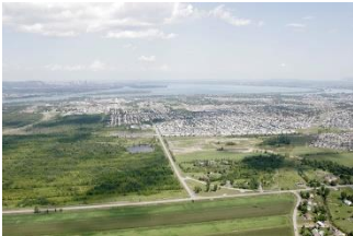
AMÉNAGEMENT DU TERRITOIRE