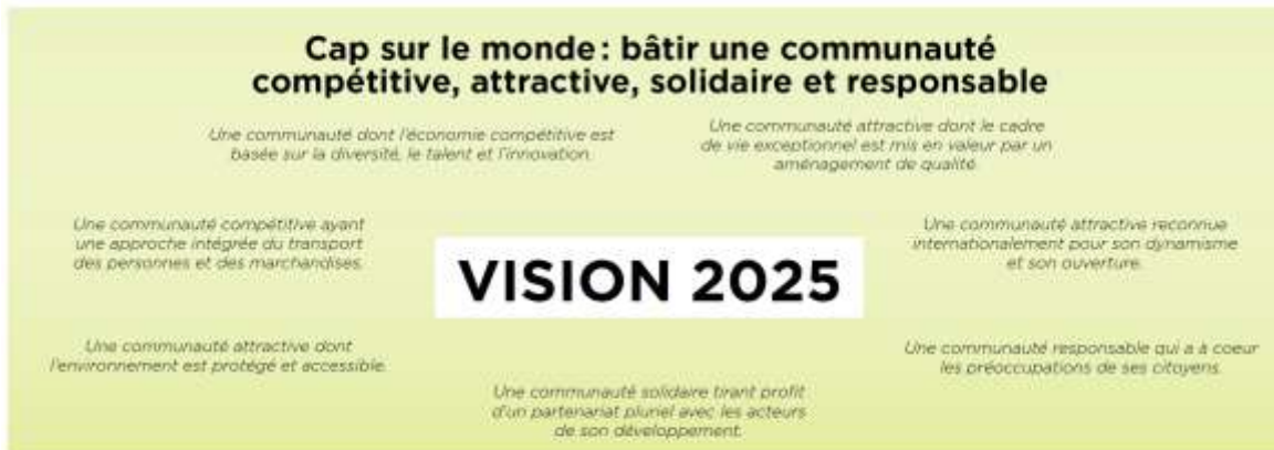
FIGURE 2 — La Vision 2025 de la Communauté adoptée par le conseil en 2003

Les orientations, les objectifs et les critères du Plan métropolitain d'aménagement et de développement s'inspirent directement de cette vision stratégique.